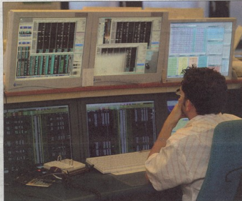
Opération bancaires. Cette formation devient un cursus reconnu par les autorités.